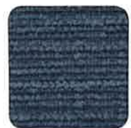
38 CAPITOL BLUE