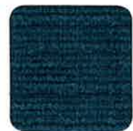
305 DEEP SEA