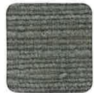
30 ROBIN'S EGG