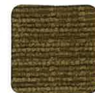
8002 CAFE AU LAIT