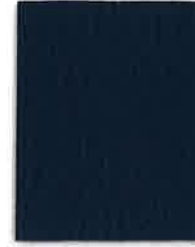
306 NAVAL BLUE WITH ENCOOL