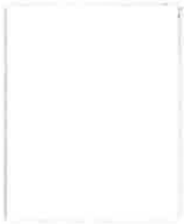
602 MYSTIC WHITE