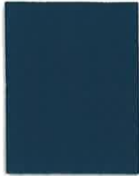
303 DENIM BLUE