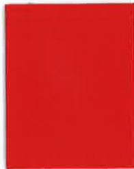
14 CHERRY RED