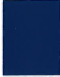
35 ROYAL WITH ENCOOL