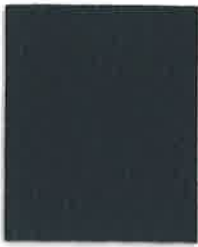
37 SMOKEY BLUE