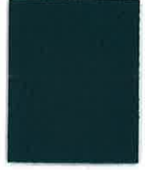
24 DEEP TEAL