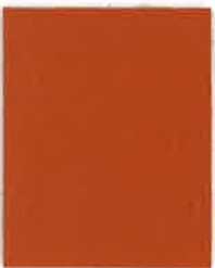
44 PUMPKIN SPICE