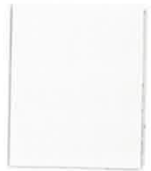
61 WHITE CAP