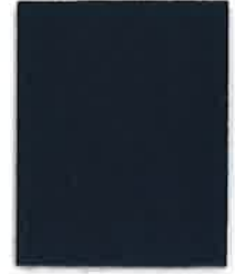
308 MIDNIGHT BLUE WITH ENCOOL