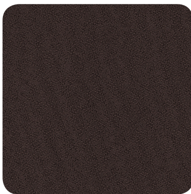
COFFEE BEAN 2083